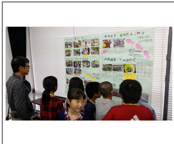
子供の部アピールタイム