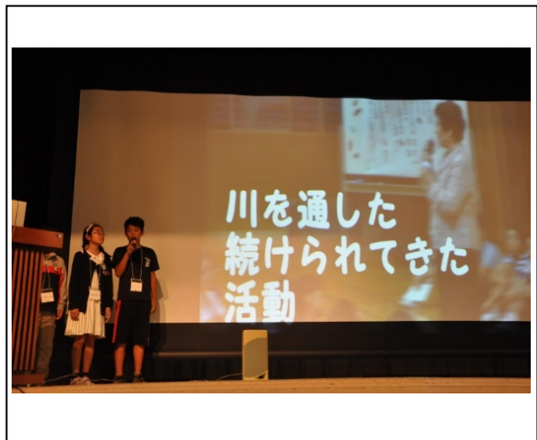
子どもの部ステージ発表