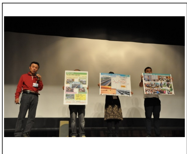
一般の部ステージ発表